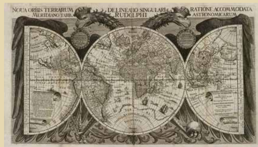
Nova Orbis Terrarum Delineatio (ca. 1658). Biblioteca del IGN (12-D-45ROM4(map01))