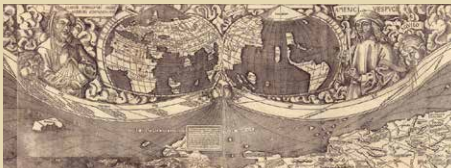
Figura 1. Detalle de la parte superior del planisferio Universalis Cosmographia (1507). Library of Congress (Washington D. C.)

A ntes del descubrimiento de América (1492) y la posterior toma de conciencia en Europa (en torno a 1503) de que esas tierras eran un nuevo continente y no parte de Asia, el mundo conocido «cabía» gráficamente en un único círculo o hemisferio. Así, tanto los mapamundis de los antiguos geógrafos griegos y romanos, como los posteriores de la Edad Media, solían tener forma de círculo. El primer mapa conocido que mostró América como un continente separado, publicado en 1507, fue también el primero en incluir un pequeño mapa en doble hemisferio a modo de diagrama explicativo de la nueva configuración del mundo (fig. 1).