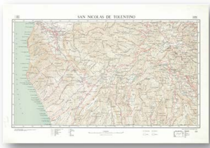
Hoja 1125: San Nicolás de Tolentino. Última hoja del mapa topográfico a escala 1:50.000 editada por el Instituto Geográfico y Catastral en 1968.