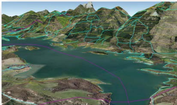
Detalle de BTN25 tridimensional sobre ortofotografía

La BTN25 es la ampliación y mejora de la antigua Base Cartográfica Numérica a escala 1:25.000 (BCN25), que constituyó la primera Base de Datos Geográfica (BDG) de referencia de todo el territorio español a dicha escala y que se obtuvo a partir del Mapa Topográfico Nacional de España 1:25.000 (MTN25) como una versión del mismo adaptada para su explotación mediante procesos informáticos.