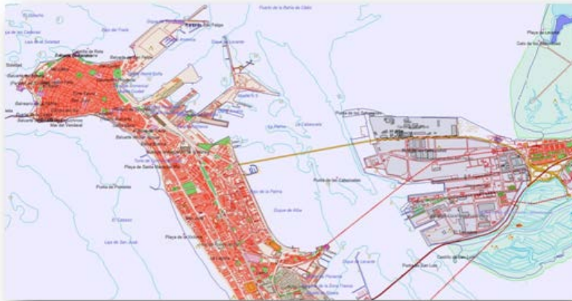
Vista de la ciudad de Cádiz en BTN25