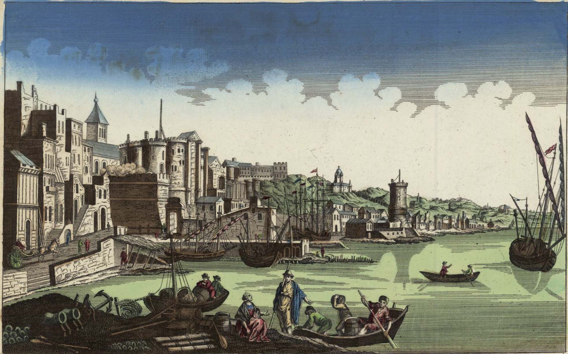
Zweijte Aufsicht von der Insul Minorcka, u einem Theil von der Stadt u, von dem Seehafen Portmahon.