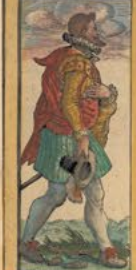
Nobilis Hispanus hodiernis ornatus incensis