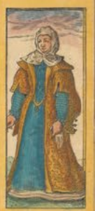
Lusitanus Mercatoris uxor honesto vestitu ambulans