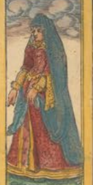
Nobilis Femina in Hispania magnifice incensis