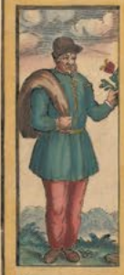
Rusticus communis Hispaniae honesto vestimento ornatus