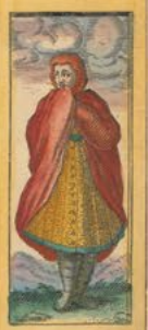
Rustica Hispana communis habitu probrans