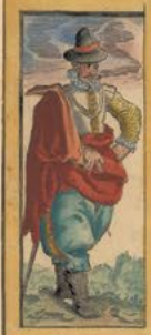
Lusitanus Mercator magnifice amictu ambulans