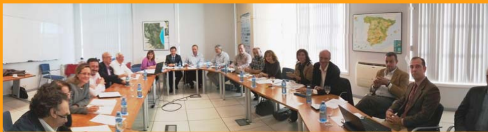
Miembros asistentes a la 20.ª Reunión de la CENG