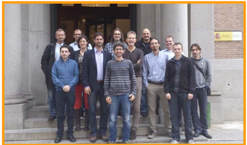
Expertos asistentes a la reunión EAGLE

Los encuentros de trabajo continuarán dentro de cuatro meses, quedando pendiente fijar la sede que acogerá la próxima reunión.