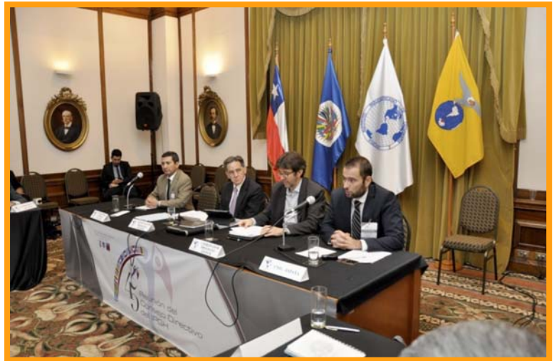
El Director del CNIG a la derecha de la imagen durante su intervención

Asimismo, se aprovechó la ocasión para celebrar el 7.º encuentro GeoSUR en la que el representante del CNIG expuso el nuevo proyecto para el año 2015 consistente en la elaboración del Mapa Integrado Andino del Norte.