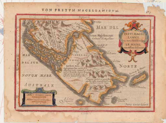
Mapa del estrecho de Magallanes (1640)

Entre las piezas a exhibir se encuentran vistas de ciudades de la época, así como fidelísimas reproducciones facsimilares de cartas náuticas, mapas, globos terráqueos y documentos históricos relativos a la expedición, todos ellos de gran interés en la conmemoración de tan increíble hazaña.