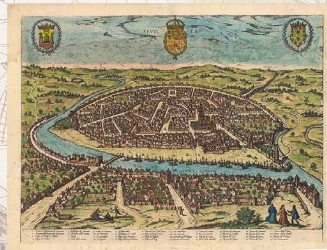
Vista de Sevilla (1588)

Nuestra exposición muestra en un recorrido cartográfico aspectos interesantes del viaje: sus antecedentes, preparativos, desarrollo y consecuencias. Partiendo de los conceptos geográficos de los antiguos, pasaremos por el inesperado descubrimiento del continente americano, el tratado de Tordesillas por el que España y Portugal se repartían el mundo, el espionaje cartográfico entre las dos potencias ibéricas, el comercio de las especias como verdadero objetivo de la expedición o los primeros mapas del estrecho de Magallanes y de las islas Molucas, todo ello ambientado en la España del siglo XVI.