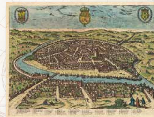
Vista de Sevilla (1588)

N uestra exposición muestra en un recorrido cartográfico aspectos interesantes del viaje: sus antecedentes, preparativos, desarrollo y consecuencias. Partiendo de los conceptos geográficos de los antiguos, pasaremos por el inesperado descubrimiento del continente americano, el tratado de Tordesillas por el que España y Portugal se repartían el mundo, el espionaje cartográfico entre las dos potencias ibéricas, el comercio de las especias como verdadero objetivo de la expedición o los primeros mapas del estrecho de Magallanes y de las islas Molucas, todo ello ambientado en la España del siglo XVI.