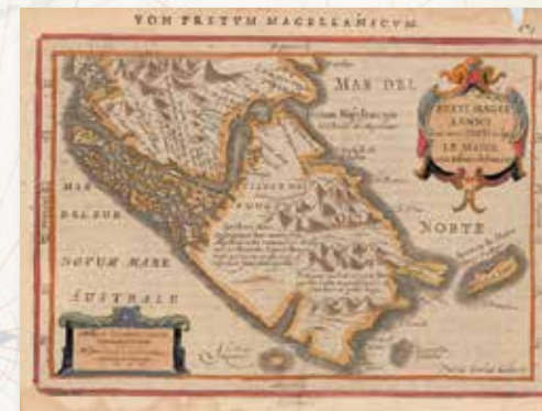
Mapa del estrecho de Magallanes (1640)

E ntre las obras a exhibir se encuentran fidelísimas reproducciones facsimilares de piezas de la época como mapas, vistas de ciudades, cartas náuticas, globos terráneos y documentos históricos relativos a la expedición, todos ellos de gran interés en la conmemoración de tan increíble hazaña.