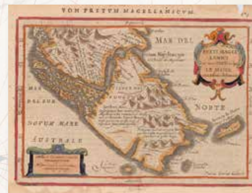
Mapa del estrecho de Magallanes (1640)

E ntre las piezas a exhibir se encuentran mapas originales y vistas de ciudades de la época, así como fidelísimas reproducciones facsimilares de cartas náuticas, mapas, globos terráneos y documentos históricos relativos a la expedición, todos ellos de gran interés en la conmemoración de tan increíble hazaña.