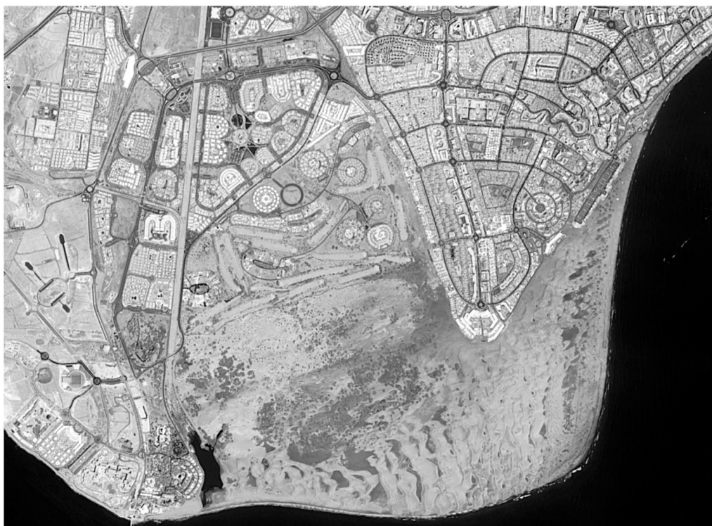
Maspalomas (sur de Gran Canaria) en 2000.