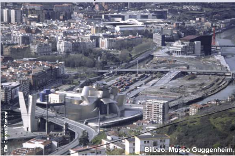
Bilbao. Museo Guggenheim.