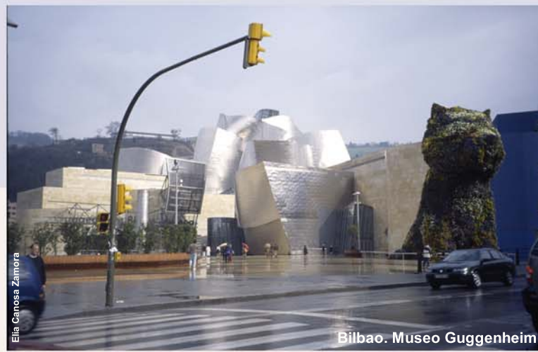
Bilbao. Museo Guggenheim.