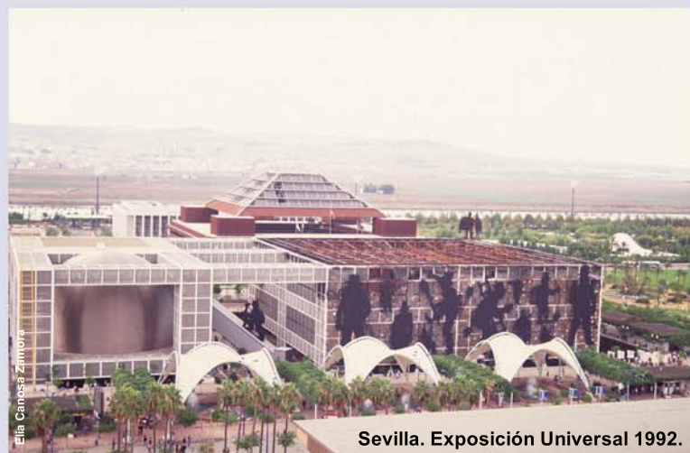
Sevilla. Exposición Universal 1992.