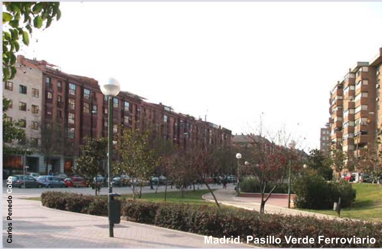
Madrid. Pasillo Verde y Recinto Ferial.