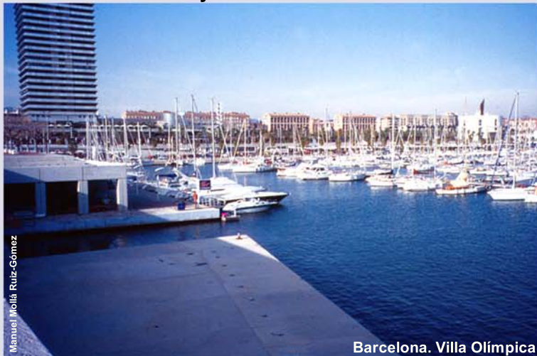
Barcelona. Villa Olímpica