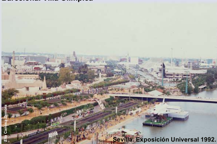
Sevilla. Isla de La Cartuja.