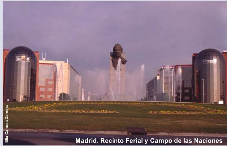
Madrid. Recinto Ferial y Campo de las Naciones