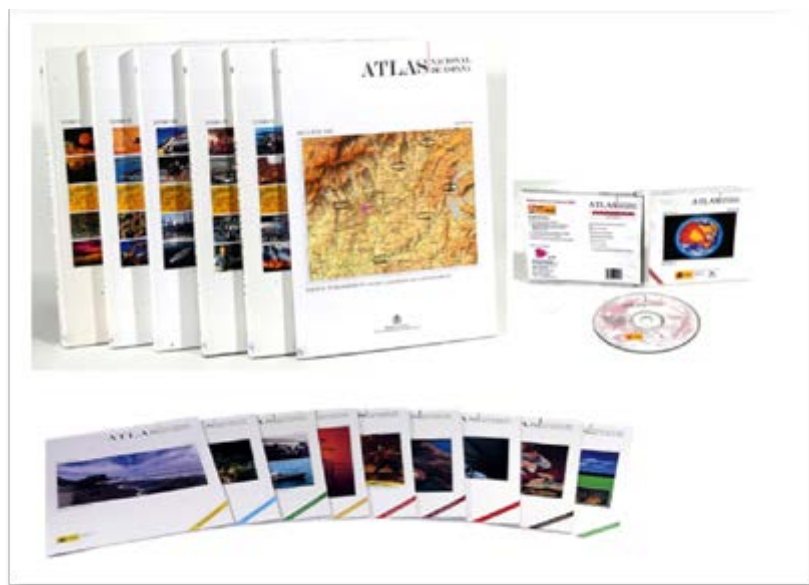
Modalidades de publicación de los grupos temáticos de la Serie General del Atlas Nacional de España: volúmenes, fascículos y libros electrónicos.