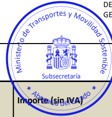
TABLA 2: presupuesto de servicios extraordinarios: