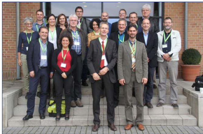
Foto de grupo del grupo y consorcio EAGLE (EIONET Action Group on Land Monitoring in Europe), durante el evento

http://www.copernicus.eu/events/new-horizons-european-and-global-land-monitoring