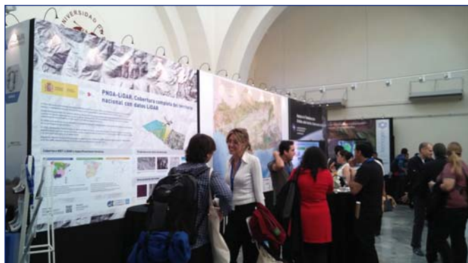
Estand del IGN-CNIG patrocinando el congreso

En esta ocasión, el congreso se celebró en Sevilla los días 21 al 23 de octubre, donde asistieron más de 230 participantes de todo el país y representantes de otros países invitados. Hubo un gran número de ponencias que versaron en torno a la temática propia de este congreso «Teledetección. Humedales y espacios protegidos», pero también se dio una gran importancia al desarrollo de las técnicas Lidar en el campo de la Teledetección y a la generación de imágenes simuladas de los futuros satélites españoles Paz e Ingenio de cara a testear los datos y estudiar sus posibles aplicaciones.