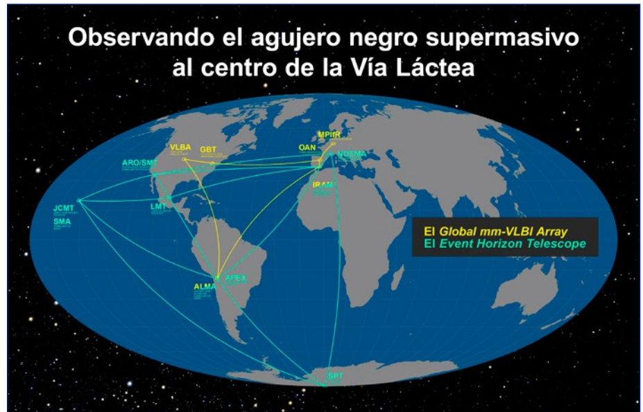
Ubicación de los telescopios que participaron en las redes GMVA (Global Millimetre VLBI Array) y EHT (Event Horizon Telescope) durante la observación del agujero negro supermasivo del centro de nuestra galaxia.

Una vez finalizadas las observaciones los radiotelescopios participantes en ambas redes han enviado sus datos a los centros de correlación de Bonn en Alemania, en el caso de la GMVA, y de Haystack en EEUU, en el caso del EHT. El procesado, reducción y análisis de los datos se realizará en los próximos meses y es probable que en el plazo de un año se anuncien los resultados si estos han sido exitosos.