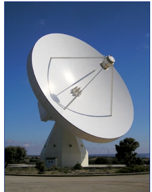
Radiotelescopio de 40 m del Observatorio de Yebes con el que, formando parte de redes europeas y globales, el IGN lleva a cabo observaciones de VLBI de interés astronómico y geodésico/geodinámico.