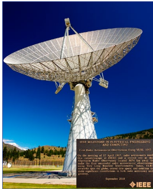
Radiotelescopio del Observatorio Radio Astrofísico de Dominion con el que junto con otro radiotelescopio del Radio Observatorio de Algonquin, ambos en Canadá, el 17 de abril de 1967 se realizó la primera observación astronómica utilizando la técnica de la VLBI.

En relación con los 50 años de existencia de la VLBI, queremos señalar que, desde hace ya más de 30 años, el IGN participa activamente en observaciones y proyectos de VLBI tanto astronómicos, como geodésicos, formando parte de redes como la EVN (Red Europea de VLBI), siendo miembro fundador (en 1993) del Instituto Conjunto para VLBI en Europa (JIV-ERIC), o haciendo aportaciones tan importantes al proyecto de VLBI geodésico VGOS (VLBI Global Observing System) como lo es la instalación y puesta en marcha de la Red Atlántica hispano-portuguesa de Estaciones Geodinámicas y Espaciales (RAEGE).