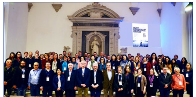
Participantes en la 12th ICA Conference "Digital Approaches to Cartographic Heritage", Venecia

http://cartography.web.auth.gr/ICA-Heritage/