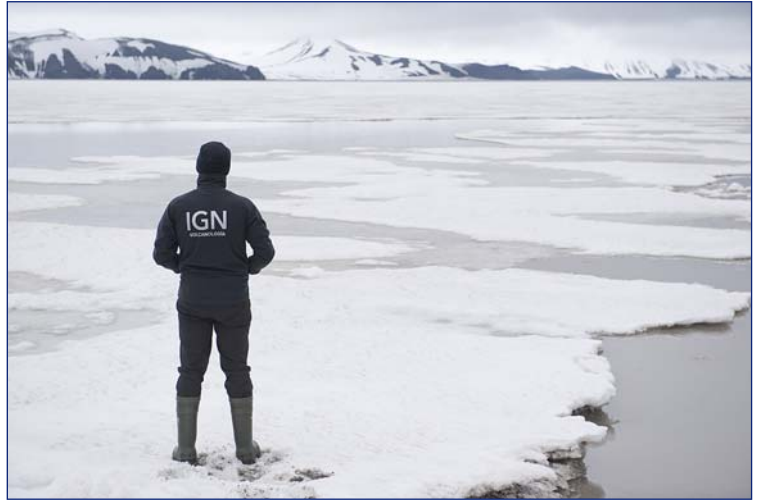
Banquisa en el interior de la Bahía de la Isla Decepción. Al fondo los Cráteres del Setenta.

Con esta actuación el IGN retoma la colaboración científico-técnica en el Programa Nacional Antártico.