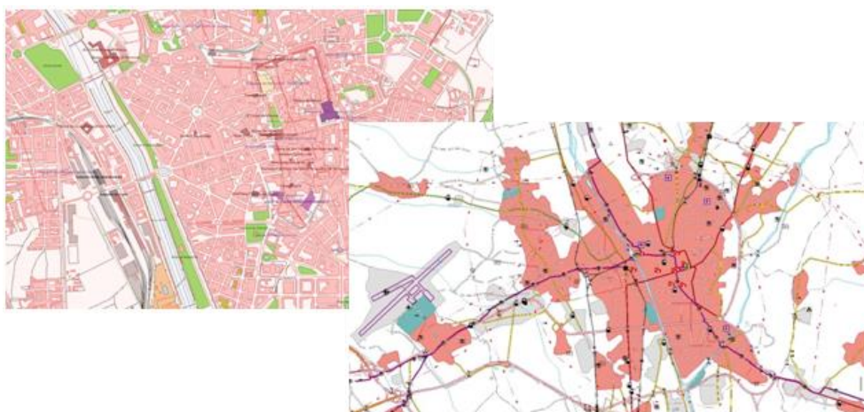
Vista de BTN y BTN100 de la ciudad de León

Todo lo relativo a la descripción de los diferentes productos de una BDG queda reflejado en las denominadas especificaciones del producto. En ellas se recogen tanto el catálogo de objetos geográficos asociado como el sistema de referencia, la calidad de los datos y los metadatos, así como la captura, el mantenimiento y la distribución de los mismos.