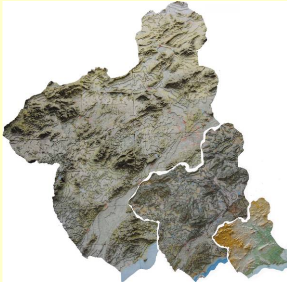
Región de Murcia en relieve