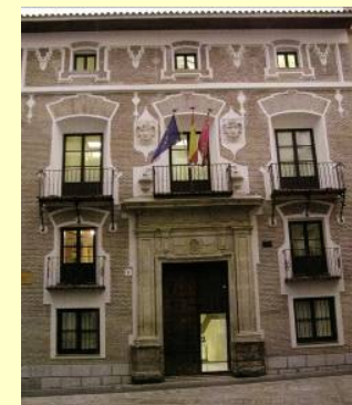
Palacio de las Balsas